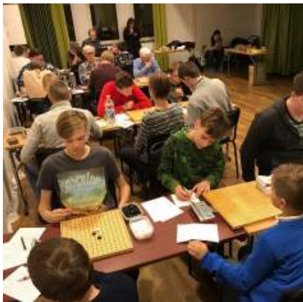
Rond 4: uppifrån sett bord 1 Poduga-Estland 2, bord 2 Jönköping-Stockholm, bord 3 Estland 3 -Estland 1, bord 4 Estland 6-Estland 4

Bilder från turneringen och prisutdelningen tagna av Irene Karlsson, det tackar vi för.