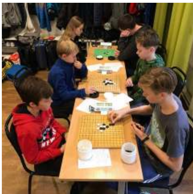
Rond 3: EST/SWE-Estland