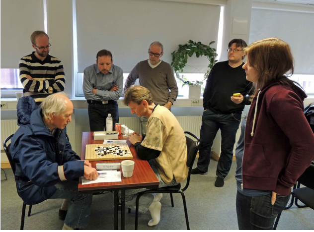
Intresserad publik vid slutstriden